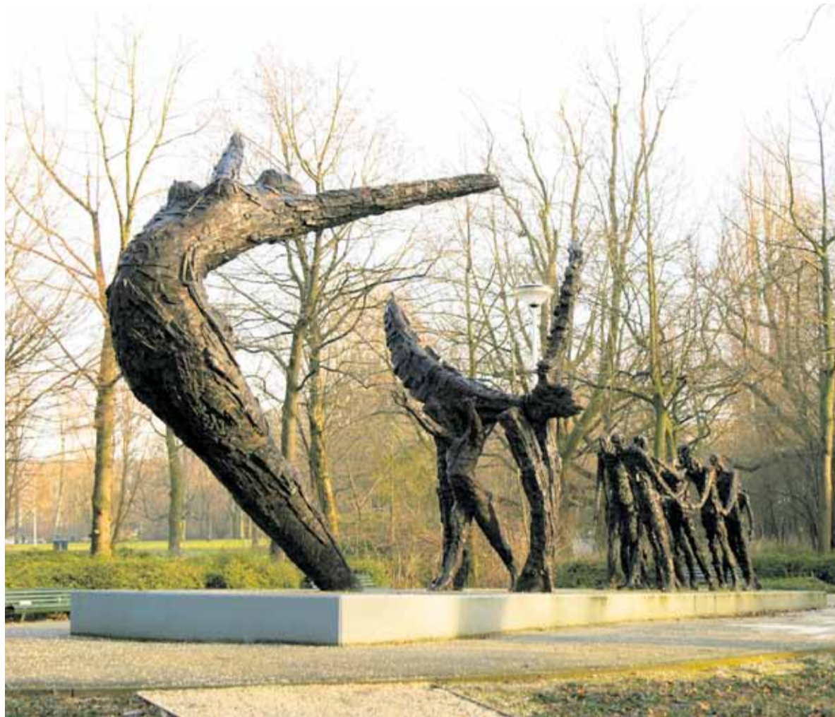
Het monument ter herdenking van de afschaffing van de slavernij staat in het Oosterpark te Amsterdam. Het werd in 2002 vervaardigd door Erwin de Vries.

Ik weet het. Het is 150 jaar geleden, laten we zeggen zes generaties. Het lijkt lang, te lang voor onze bleekschetige hersenen. Maar pas in 1873 mochten ze echt weg en was die slavernij dus pas echt afgelopen. In 1945 was dat pas 72 jaar geleden. Heeft u die ouder bent dan ik, die het begin van de oorlog nog heeft meegemaakt, ooit in die tijd horen treuren over de slaven en dat harde verleden van Nederland? Het is nu 72 jaar geleden dat de oorlog uitbrak, en wat vindt u van Duitsers die vinden dat het nou maar eens afgelopen moet zijn met herdenken, treuren en