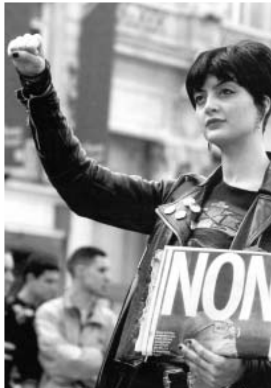
Nee tegen de verrechtsing

Ongehoorzamen staan tegenover rechtvaardigen. Voor religieuze moraalriders blijft dat een vers om na te denken over al te fundamentalistische interpretaties van de wil van God. U begrijpt mijn pret, ik heb de pest aan moraalriders, zeker als die zich dan nog hebben opgesierd met politieke macht. Gods volk heeft bekering nodig en ook bekering van de vaders tot de kinderen.