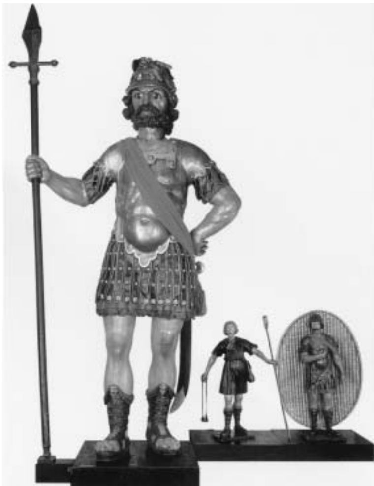
Goliath, David en de lansnecht

Vele opvoeders, en niet alleen christenen, zouden bepaalde bijbelverhalen waaronder dat over David en Goliath graag anders overgeleverd hebben gekregen: zonder oorlog en zonder geweld. Eerlijk gezegd was ook mij dat verlangen lange tijd niet vreemd. Maar ik wil ook niet ontkennen, dat ik als kind best wel smulde van die David die als een sprookjesachtig Klein Duimpje toch maar in staat was de Grote Reus te verslaan. En mijn kinderziel heeft er 'meen ik nu' niet onder geleden. In de loop der jaren ben ik echter die verhalen over de grote bijbelfiguren met andere ogen gaan lezen. Vandaag de dag zou ik het zelfs jammer vinden als we niet het verhaal hadden over Abram die betrokken werd in de oorlog van de koningen van het Oosten. Of dat ons verzwegen was dat Mozes in zijn jongelingsdagen een moord op een Egyptenaar had gepleegd. Ook het verhaal over Paulus die hand- en spandiensten verleende bij de steniging van Stefanus en over Jezus met zijn 'zweep' - van touwen! - op het tempelplein zegt mij nu iets anders dan toen ik het als kind aanhoorde. Dat anders horen begon al toen ik als gymnasiast teksten van Homerus moest vertalen. De bijbelse helden waren in mijn ogen maar slappelingen vergeleken bij Achilles en Ajax. Die godenzonen