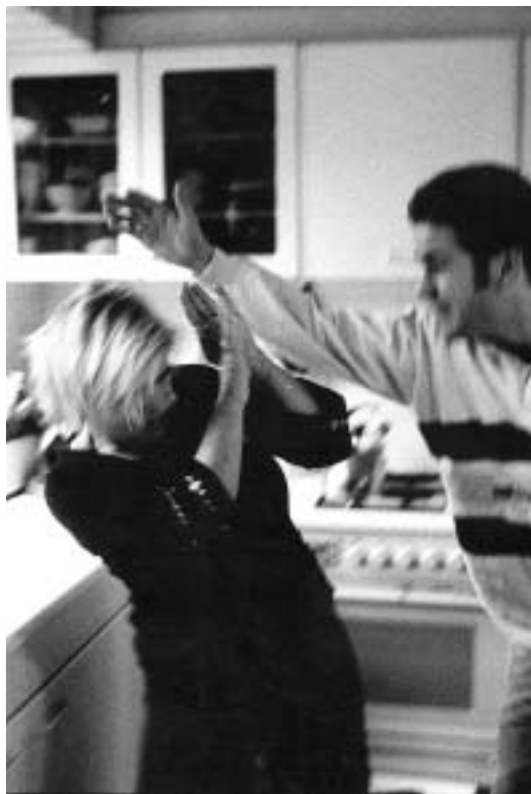
Huiselijk geweld, uit: Niet bang voor geweld

te vinden: het andere verhaal spreekt over vrouw als geschapen uit een rib van de man. Daarom wordt soms beweerd dat de vrouw een afgeleide is van de man en onder hem staat. Het verhaal dat in de brochure als uitgangspunt genomen wordt geeft daar geen ruimte voor.