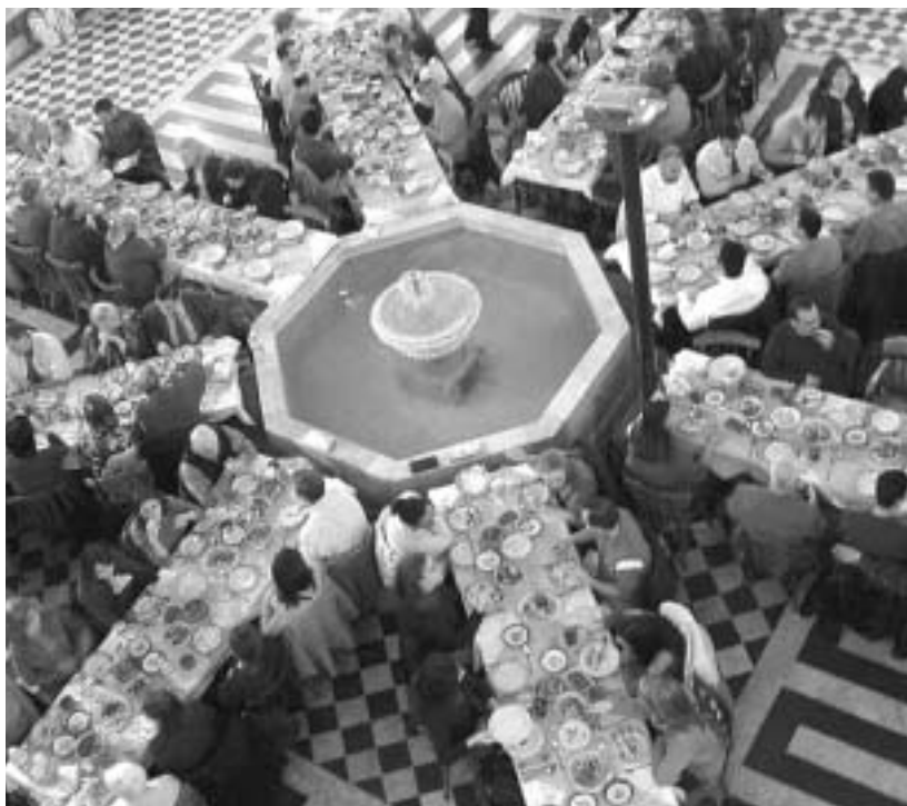
Ramadan betekent ook 40 dagen lang elke avond feest

De islamitische Ramadan en het christelijke vasten hebben dan ook iets gemeenschappelijks. In het islamitische vasten krijgt beteugelen centrale aandacht; beteugelen van de nefs. De nefs, een Arabisch woord dat zelf betekent, is een centrum in de mens waar zich de aandriften bevinden die het voortbestaan van de mens in stand houden. Door de aanwezigheid van de nefs heeft de mens behoefte om te eten, te drinken en zich voort te planten maar ook om zich te bewijzen tegenover anderen en zich met name in materieel opzicht verder te ontplooiën en rijkdom te vergaren. Het evenwicht beteugelen van de nefs is een belangrijke voorwaarde voor de overleving en instand-