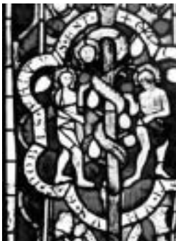
Traditionele interpretaties lezen het tweede scheppingsverhaal als legitiematie voor onderwerping van vrouwen. Het eerste scheppingsverhaal sluit hiërarchie uit.

Nee, gelijkwaardigheid staat centraal. Dat wil niet zeggen dat mannen en vrouwen geen verschillende entiteiten zijn, maar er is geen hiërarchische verhouding. In Genesis zijn in feite twee scheppingsverhalen