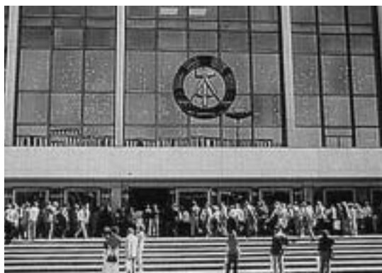
Openingsdag van het Volkspalast (Palast der Republik)

Zo was het DDR-gebied het Duitsland met een naar verhouding grote nazi-aanhang, vanwege de grootgrondbezitters. Tegelijk waren het vooral overlevenden van concentratiekampen die de leiding in dat gebied kregen; het zette vanaf de aanvang de verhouding tussen volk en leiding onder grote psychologische druk. De DDR ontstond, doordat de westelijke geallieerden een "west-Duits" gebied formeerden (grondwet, munt en regering) en men in de "Russische bezetingszone" met gelijke maatregelen (grondwet, munt en regering) reageerde; de staat ontstond uit historische strijd tussen de geallieerden, niet uit eigenstandige besluitvorming. In de DDR werden fascistische leraren uit de scholen ontslagen en vaak door kerken weer als godsdienstleraren teruggeplaatst, waardoor ook die verhoudingen wonnen aan wantrouwen. De Sovjet-Unie, die zwaar door de oorlog beschadigd was, haalde wat nog bruikbaar was weg uit de DDR voor eigen herstel. Tegelijk werd West-Berlijn materieel opgetuigd door Marshall-hulp. Stalin zette op het geheel zijn eigen druk. Oost en West kwamen heftig tegenover elkaar te staan (Churchill: "We hebben het verkeerde varken