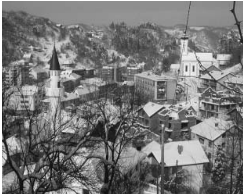
De winter was lang in Srebrenica, met veel sneeuw

Van begin 2001 tot eind 2003 liep het project Civiele Buitenlandse Aanwezigheid. In de periode van terugkeer van de moslimbevolking (Bosniaks) naar Srebrenica waren permanent gemiddeld 8 vrijwilligers daar 2 maanden permanent aanwezig als bijdrage aan een positieve ontwikkeling in Srebrenica. Het doel was om door de aanwezigheid van deze vrijwilligers contact te maken tussen de bevolkingsgroepen en de spanning te verminderen. Na de val van Srebrenica woonden er 7.000 Serviërs, waarvan het grootste deel vluchteling uit andere delen