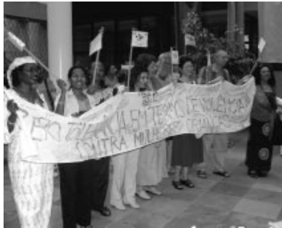
Oproep 'Nul-tolerantie bij geweld tegen vrouwen'.