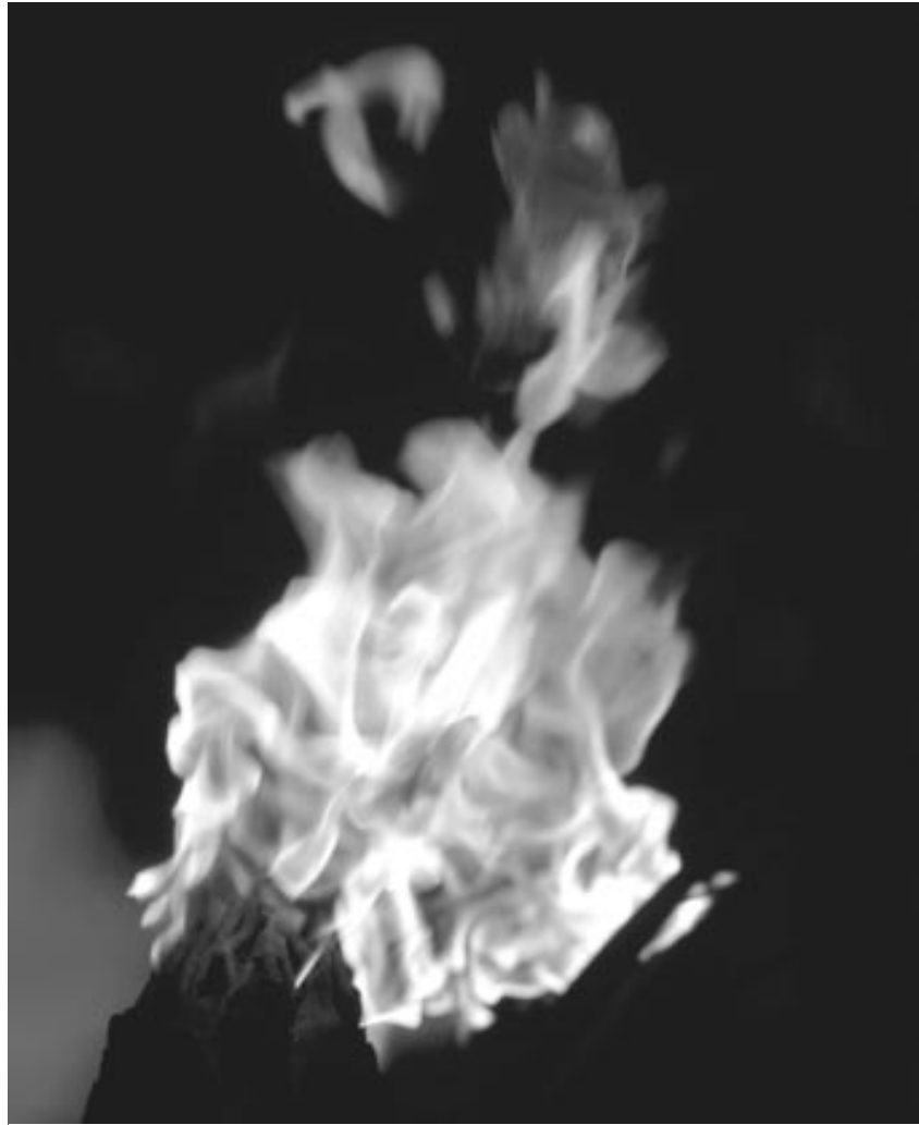
Vuur als metafoor